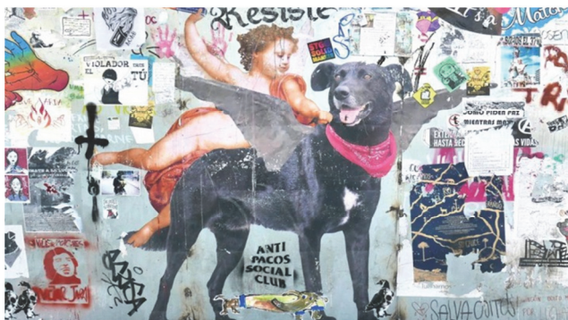
San Matapacos, Anónimo, acceso oriente del GAM