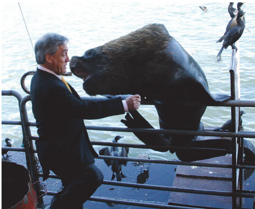
Lobo Marino ataca a Sebastián Piñera 11 de septiembre 2005