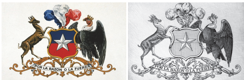
Escudo de Chile

Homenaje al Negro Matapacos, símbolo de los movimientos sociales chilenos actuales