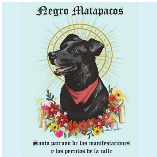
Negro Matapacos. Anónimo. 7 noviembre 2019. fmdos.cl