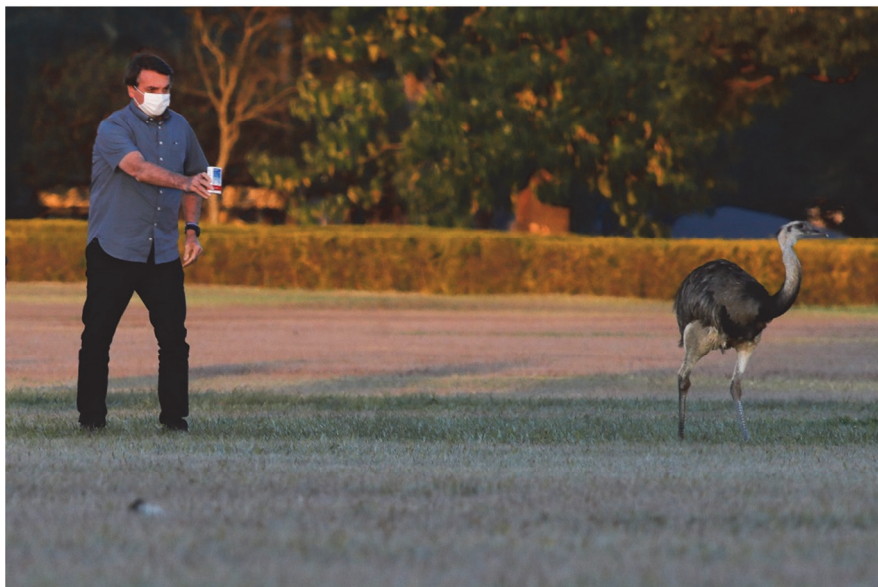
Bolsonaro muestra una caja de coloroquina a los ñandús del Palacio de la Alvorada. 23 de abril 2020.

ARRUDA LEAL FERREIRA, Arthur. «Bitácoras biopolíticas entre Brasil y Chile; perros, ñandús, milicos, militantes y coronavirus». HYBRIS. Revista de Filosofía, Vol. 11 N° Especial Biopolíticas. Laboratorios Contemporáneos. ISSN 0718-8382, Septiembre 2020, pp. 93-110